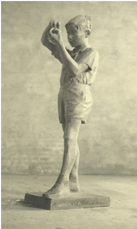
© VG Bild-Kunst, Bonn; Sylvia Hagen