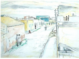
© VG Bild-Kunst, Bonn; Dr. Sigmar Uhlig