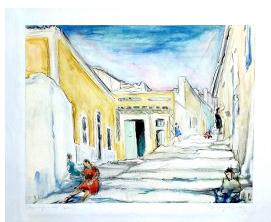
Treppenstufen in Ibiza, undatiert [1955] Aquarellfarbe über Graphit auf Aquarellkarton 50,0 x 64,5 cm mit Bezeichnung und Signatur

© VG Bild-Kunst, Bonn; Dr. Sigmar Uhlig