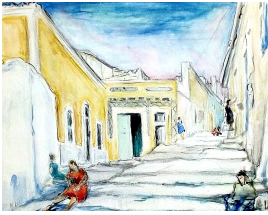
© VG Bild-Kunst, Bonn; Dr. Sigmar Uhlig