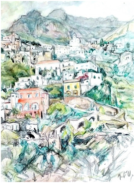
© VG Bild-Kunst, Bonn; Dr. Sigmar Uhlig