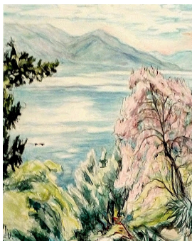
© VG Bild-Kunst, Bonn; Dr. Sigmar Uhlig