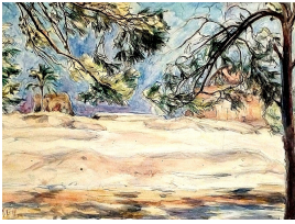
© VG Bild-Kunst, Bonn; Dr. Sigmar Uhlig