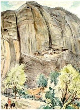
© VG Bild-Kunst, Bonn; Dr. Sigmar Uhlig