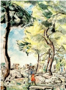
© VG Bild-Kunst, Bonn; Dr. Sigmar Uhlig