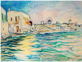
© VG Bild-Kunst, Bonn; Dr. Sigmar Uhlig Foto: Dr. Sigmar Uhlig