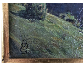
Bergell 1953 Öl auf Holz 40 x 50 cm Bildausschnitt u.l.mit Monogramm in Ligatur