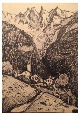
unbenannt [Kirche im Bergell], undatiert Feder, Tusche auf Zeichenpapier in: Skizzenblock