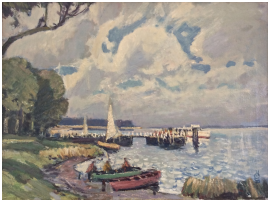
© Erika Bauer Foto: Annette Purfürst