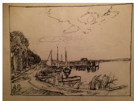
Neue Scheune in Ferch, undatiert Feder, Tusche, Bleistift auf Papier in: Skizzenbuch Signatur recto u.l.: Monogramm in Ligatur