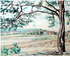
© VG Bild-Kunst, Bonn; Dr. Sigmar Uhlig