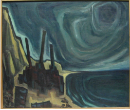
© VG Bild-Kunst, Bonn Foto: Thomas Kumlehn