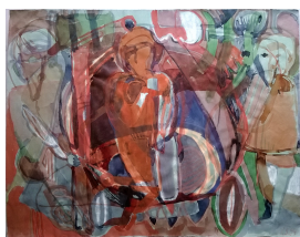
Einbalsamierung 1994 Gouache 48,5 x 62 cm

© VG Bild-Kunst, Bonn; Rose und Otto Schack