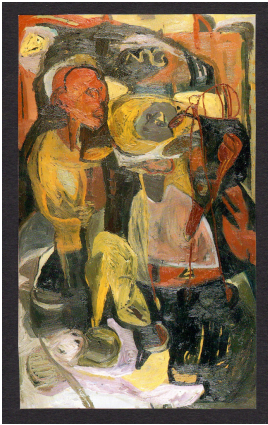
© VG Bild-Kunst, Bonn; Rose und Otto Schack