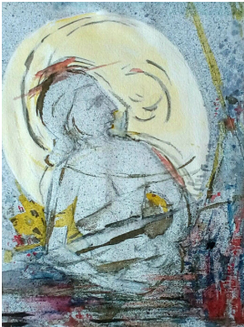
© VG Bild-Kunst, Bonn; Dr. Sigmar Uhlig Foto: Siegfried Jahn