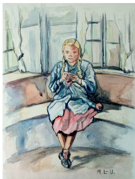
unbenannt [Im Erker III], undatiert [nach 1926] Aquarell über Graphit auf Aquarellkarton 44.0 x 33.9 cm

© VG Bild-Kunst, Bonn; Dr. Sigmar Uhlig