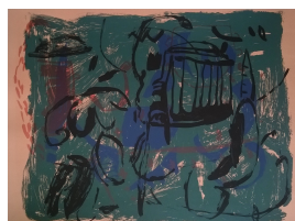
Ohne Eskorte 1994 Farbsiebdruck 44 x 59,5 cm

© VG Bild-Kunst, Bonn; Rose und Otto Schack