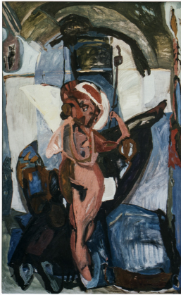
© VG Bild-Kunst, Bonn; Rose und Otto Schack Foto: Philipp Schack

Nachlass: Schack, Philipp [Werkverzeichnis Malerei] Werkverzeichnis-Nr.: 048 Objekttyp: Gemälde Gründe der Datierung: Sign. recto + Bez. verso (Freitext):