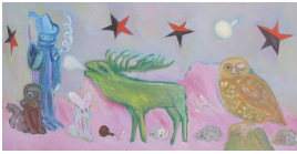
© Magdalena Lauche Foto: Thomas Kumlehn