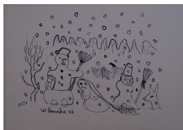
Walter Lauche unbenannt, 2003 Tusche auf Karton 43 x 61 cm