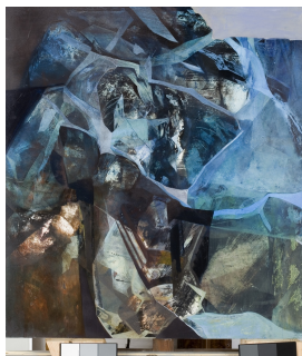
Ohne Titel [Raumschwingungen] (Zwischenstadium) 2002-2007 Mischtechnik auf Karton/Holz 100 x 90 cm