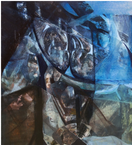
© Hans-Joachim Rose, Daniel Rose, Benjamin Rose Foto: Monika Schulz-Fieguth