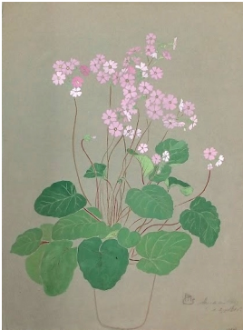
© VG Bild-Kunst, Bonn; Dr. Sigmar Uhlig