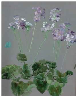
unbenannt [Studienblatt: Primel], undatiert [um 1906] Aquarellfarbe auf farbigem Papier 53.7 x 43.8 cm

© VG Bild-Kunst, Bonn; Dr. Sigmar Uhlig Foto: Siegfried Jahn