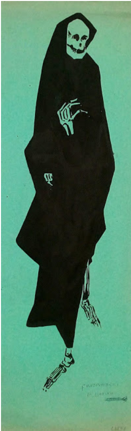
© VG Bild-Kunst, Bonn; Dr. Sigmar Uhlig

unbenannt [Studienblatt: Skelett mit schwarzem Umhang]