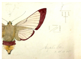
unbenannt [Studienblatt: Falter II], 1905 Aquarellfarbe über Graphit auf farbigem Papier 42 x 51.3 cm Ausschnitt mit Signatur und Datierung

© VG Bild-Kunst, Bonn; Dr. Sigmar Uhlig