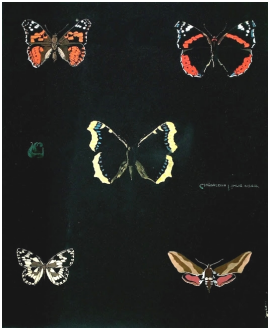
© VG Bild-Kunst, Bonn; Dr. Sigmar Uhlig