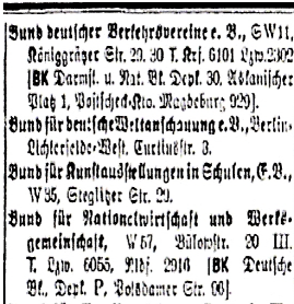
Ausschnitt aus dem Berliner Adressbuch für das Jahr 1929, Erster Band, S. 443

© VG Bild-Kunst, Bonn; Dr. Sigmar Uhlig Foto: Siegfried Jahn