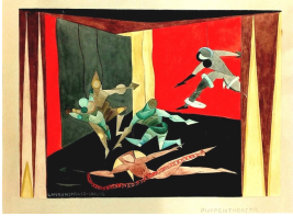
© VG Bild-Kunst, Bonn; Dr. Sigmar Uhlig