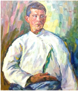
© VG Bild-Kunst, Bonn; Dr. Sigmar Uhlig Foto: Siegfried Jahn

unbenannt [Junger Verwundeter] Magda Langenstraß-Uhlig, undatiert [um 1916]