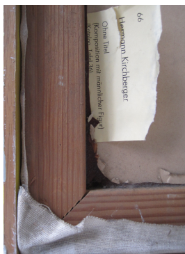
unbenannt [Männliche Figur] (verso: Detail) 1970 Öl- und Temperafarbe auf Leinwand, auf Pappe 148 x 125 cm

© Hans-Joachim Rose Foto: Thomas Kumlöhn