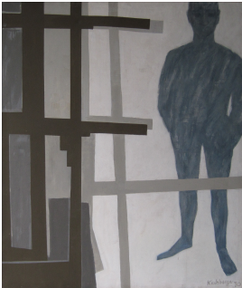
© Hans-Joachim Rose Foto: Thomas Kumlehn