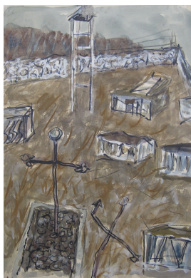
Hermann Kirchberger unbenannt vermtl. um 1968 Gouache auf Papier 41,5 x 29,5 cm

© Hans-Joachim Rose Foto: Thomas Kumlehn