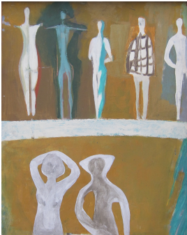
© Hans-Joachim Rose Foto: Thomas Kumlehn