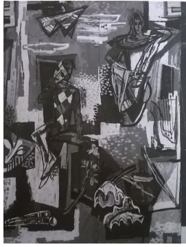
Hermann Kirchberger Karton zu Mosaiksäule im Deutschen Nationaltheater Weimar, 1947/48 ohne Technik, ohne Maße Abb.vorlage: s/w Foto/Papier