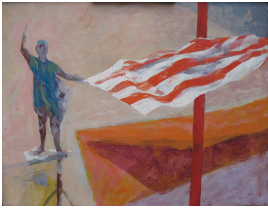
© Hans-Joachim Rose Foto: Thomas Kumlehn