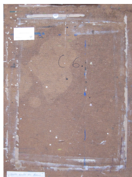
Nachts hinter der Bühne (verso) 1972 Öl- und Temperafarbe auf Hartfaser 81 x 65 cm

© Hans-Joachim Rose