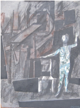
© Hans-Joachim Rose Foto: Thomas Kumlehn