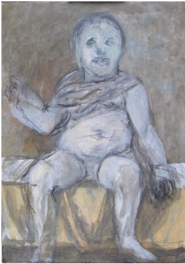
© Hans-Joachim Rose Foto: Thomas Kumlehn