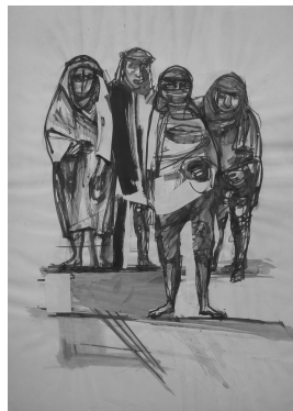
Hermann Kirchberger unbenannt 1969-71 Tusche auf Papier 61 x 44 cm

© Hans-Joachim Rose Foto: Thomas Kümlehn