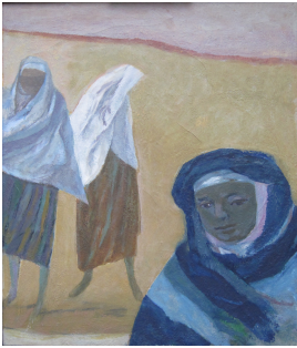
© Hans-Joachim Rose Foto: Thomas Kümlehn