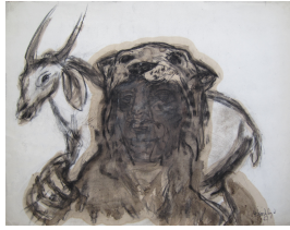
Hermann Kirchberger unbenannt 1967 Tusche auf Papier 53,5 x 69 cm

© Hans-Joachim Rose