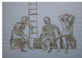
Hermann Kirchberger unbenannt undatiert Tusche auf Papier 42,5 x 61 cm

© Hans-Joachim Rose Foto: Thomas Kümlehn