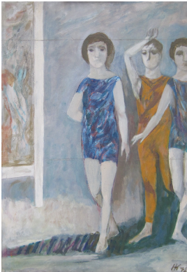
© Hans-Joachim Rose Foto: Thomas Kumlehn

Nachlass: Kirchberger, Hermann [Nachlassverzeichnis Malerei] Nachlass-Nummer: C 10 Objekttyp: Gemälde Entstehungsort: Atelier, Berlin