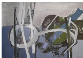
Becky Sandstede unbenannt [Landschaft/Draufsicht], 1956 Temperafarbe auf braunem Karton 34 x 50.5 cm

© Hans-Joachim Rose Foto: Sabine Hebecker