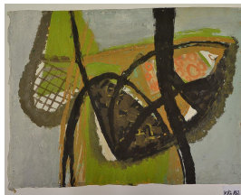
Hermann Kirchberger unbenannt [abstrakte Komposition], 1953 Gouache auf Papier 48 x 62 cm

© Hans-Joachim Rose Foto: Sabine Hebecker