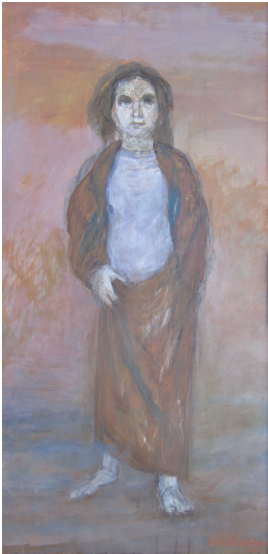
© Hans-Joachim Rose Foto: Thomas Kumlehn