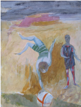
© Hans-Joachim Rose Foto: Thomas Kumlehn