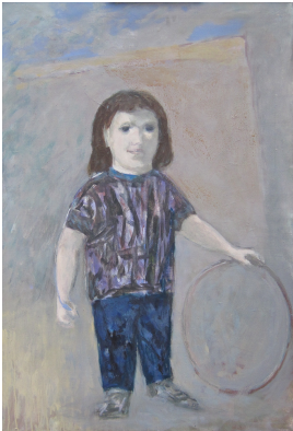
© Hans-Joachim Rose Foto: Thomas Kumlehn