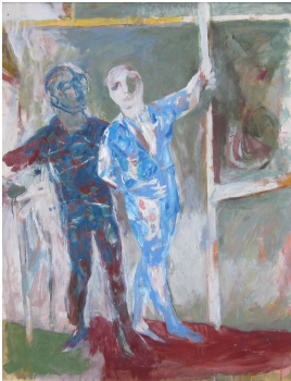
© Hans-Joachim Rose Foto: Thomas Kumlehn

unbenannt [Zwei Artisten] Hermann Kirchberger, undatiert [um 1960]