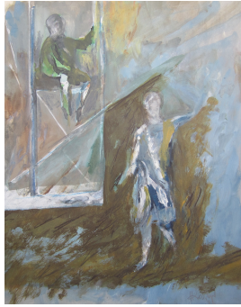
Hermann Kirchberger Auf der Schaukel 1976 Gouache auf Papier 57,5 x 46 cm

© Hans-Joachim Rose Foto: Thomas Kümlehn