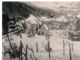
Nahender Schneesturm über Bergholz-Rehbrücke, undatiert [nach 1927] Öl auf Leinwand 65.5 x 84.5 cm Abb. nach einem s/w - Foto