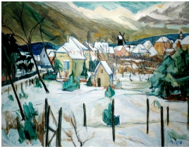
© VG Bild-Kunst, Bonn; Dr. Sigmar Uhlig Foto: Siegfried Jahn