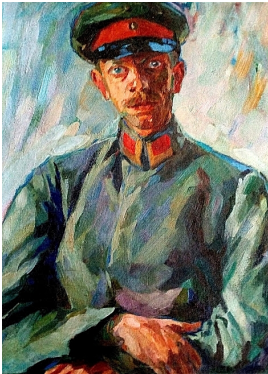
© VG Bild-Kunst, Bonn; Dr. Sigmar Uhlig