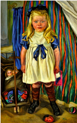
© VG Bild-Kunst, Bonn; Dr. Sigmar Uhlig