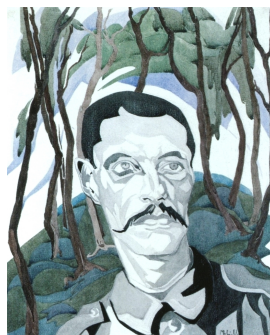
Sächsischer Waldarbeiter in der Kriegszeit, undatiert [um 1932] Aquarellfarbe über Graphit auf Aquarellkarton 49.1 x 39.6 cm

© VG Bild-Kunst, Bonn; Dr. Sigmar Uhlig Foto: Klassik Stiftung Weimar