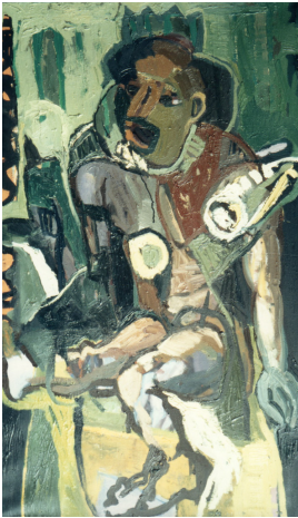
© VG Bild-Kunst, Bonn; Rose und Otto Schack