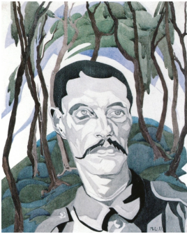
© VG Bild-Kunst, Bonn; Dr. Sigmar Uhlig