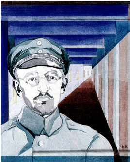
© VG Bild-Kunst, Bonn; Dr. Sigmar Uhlig Foto: Klassik Stiftung Weimar