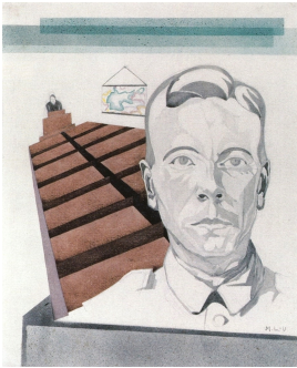
© VG Bild-Kunst, Bonn; Dr. Sigmar Uhlig Foto: Klassik Stiftung Weimar