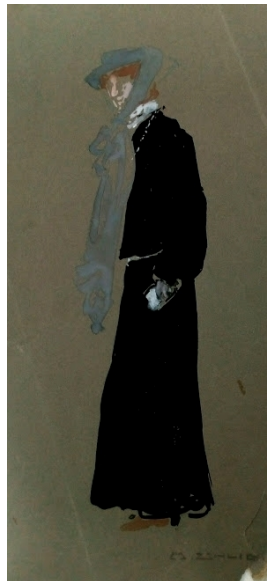
unbenannt [Studienblatt: Frau mit schwarzem Kleid], 1906 Aquarellfarbe auf braunem Papier 32.0 x 15.0 cm

© VG Bild-Kunst, Bonn; Dr. Sigmar Uhlig