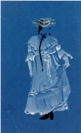
© VG Bild-Kunst, Bonn; Dr. Sigmar Uhlig Foto: Klassik Stiftung Weimar

unbenannt [Studienblatt: Dame mit weißem Kleid]