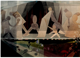
© VG Bild-Kunst, Bonn; Dr. Sigmar Uhlig Foto: Klassik Stiftung Weimar