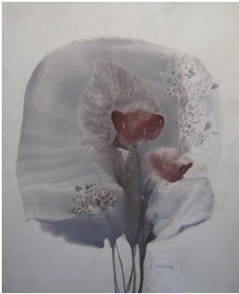
© Hans-Joachim Rose Foto: Thomas Kumléhn