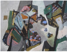
© Hans-Joachim Rose Foto: Thomas Kumlehn

unbenannt [Landschaft/Traum/Draufsicht] Becky Sandstede (Künstler/in), 1953