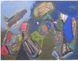
© Hans-Joachim Rose Foto: Thomas Kumlehn

unbenannt [Landschaft/Traum/Draufsicht] Becky Sandstede (Künstler/in), undatiert [um 1955]